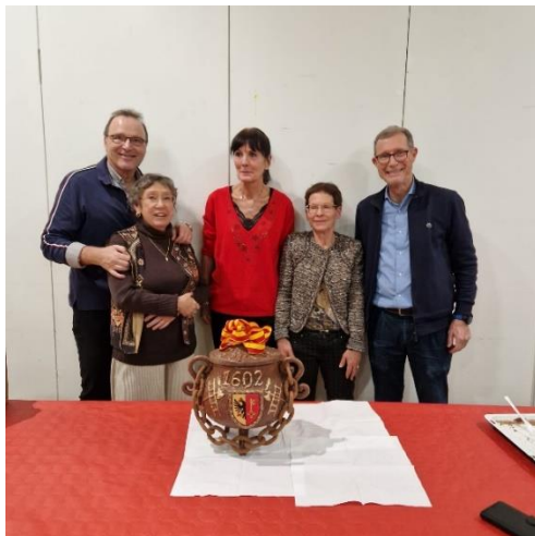
Le «bureau» 2023 autour de la Marmite de l'Escalade

Notre Fête de fin d'année le 11 décembre 2023 a été un grand succès : spectacle de la troupe Les Antidépresseurs (« Ecoute, j'ai un truc à te dire »), animation musicale par le trio de jazz Bazar, buffet et marmite de l'Escalade. L'ambiance a été particulièrement chaleureuse.