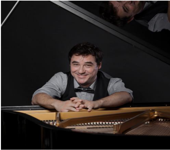
Les chansons d'Olivier Grimm