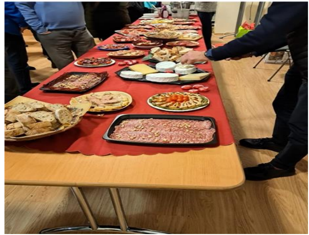
Le buffet copieux et coloré »