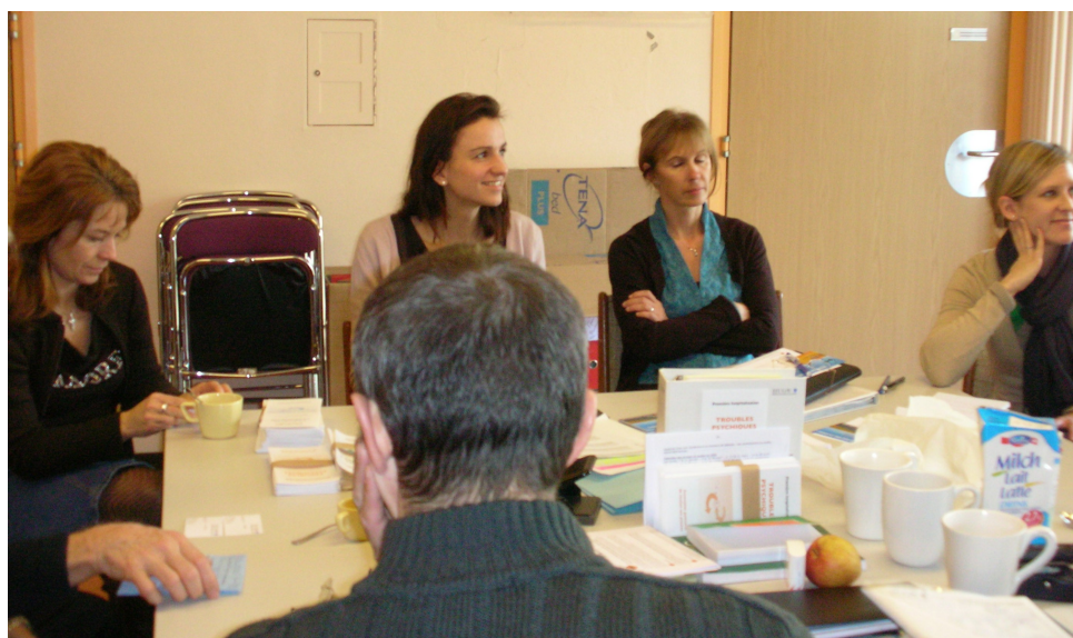
Réunion de l'Equipe mobile