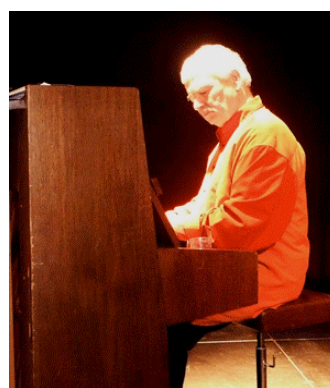
Notre pianiste bien connu