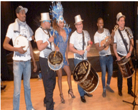
C'est le Brasil !